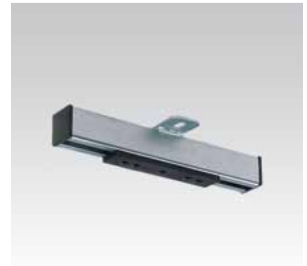
Glissière coulissante M10