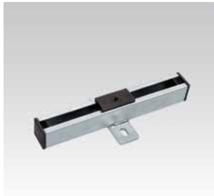
Glissière coulissante M8