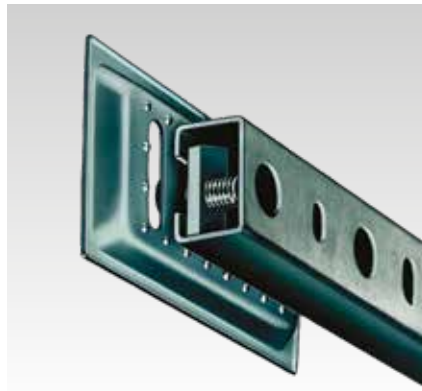
Nervures arrières permettant un montage parfaitement horizontal sur les rails