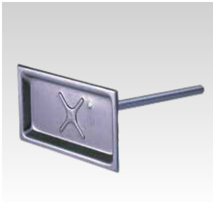
Boîtier avec tige à souder