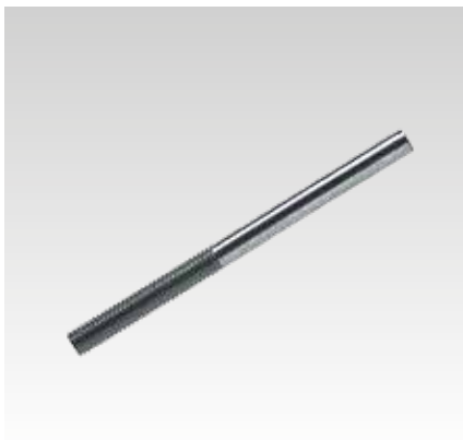
Tige à souder