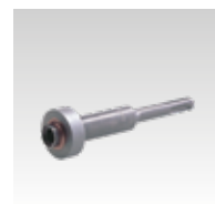
Outil pour perforateur