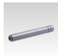
Outil à frapper