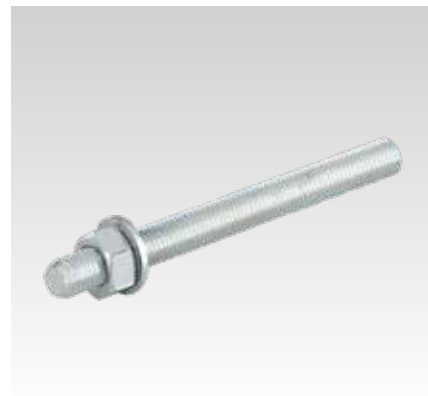
Ankerdraden voor massieve en holle steen type VMU-A, klasse 5.8