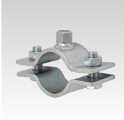
Collier pour point fixe 60 x 6