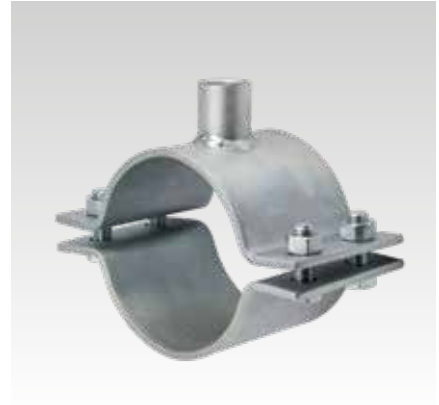
Collier pour point fixe 120 x 6