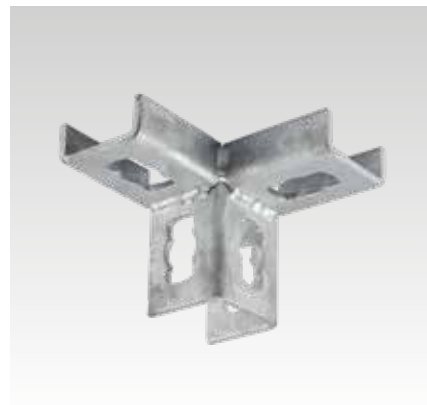
MPR Zijhoekverbinder links type S+1