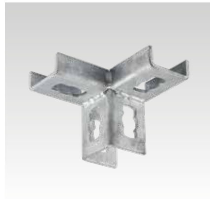
MPR Zijhoekverbinder rechts type S+1